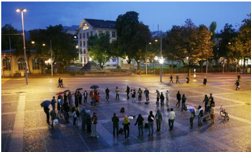
Gemeinsames Gebet auf dem Platz, den eigentlich die Linke für sich reklamiert.

Sie singen eine halbe Stunde im Kreis auf dem Helvetiaplatz und beten für sich und alle, die es ihrer Meinung nach brauchen – auch für den «Tages-Anzeiger».